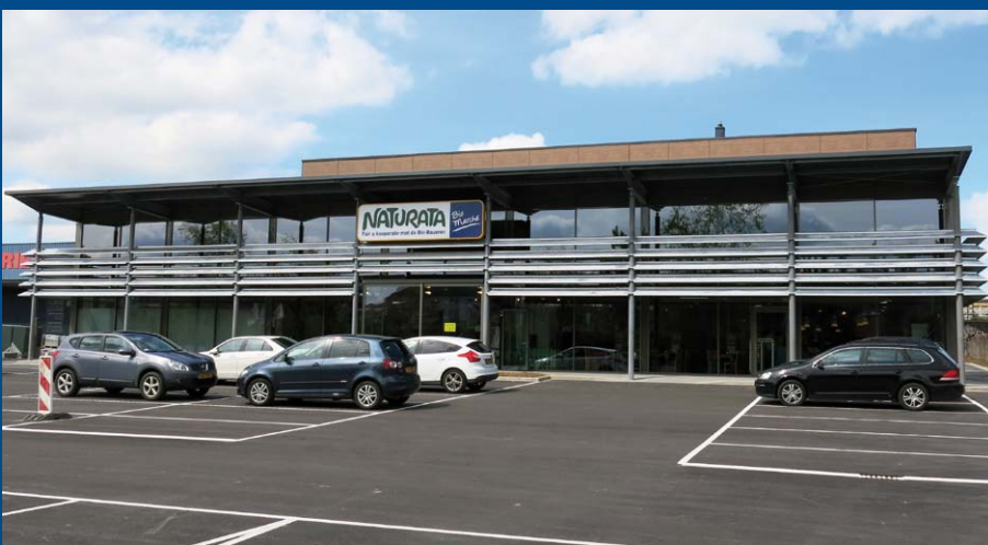
Trotz Panoramaverglasung energiesparend: NATURATA Belval ist gleich in doppelter Hinsicht eine wunderbare Vitrine für Naturprodukte

„Produkte, die gesund sind für uns und unsere Familie, aber auch für die Umwelt“, noch dazu im Rahmen eines regionalen Netzwerks – „diese Werte unterstützen wir in Esch.“